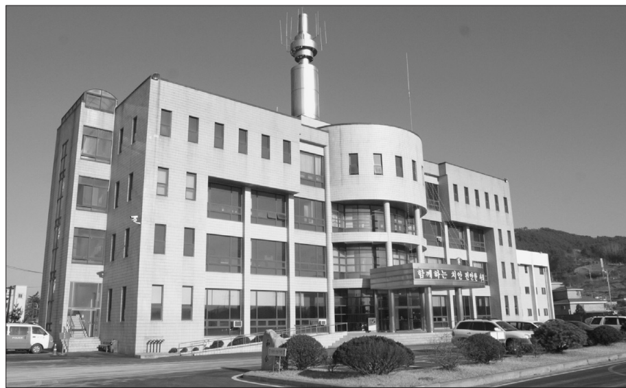
포천시민과 함께하는 치안, 편안하고 열린 사회 구현의 센터 포천경찰서 전경.

▶최호열 발행인: 43번 국도와 47번 국도의 출퇴근길 심각한 교통체증을 해소하는 것이 포천시의 큰 과제입니다. 교통체