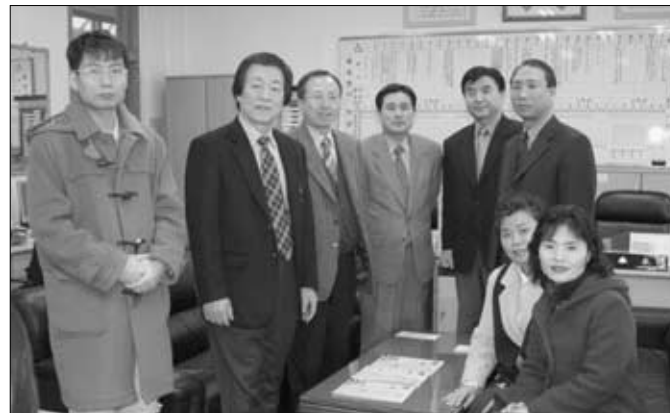
일동초등학교 교무실에서 일동중학교,운남초등학교,이동초등학교와 일동초등학교 학생들을 인솔하고 불우이웃돕기 행사에 참가한 학교 관계자와 함께