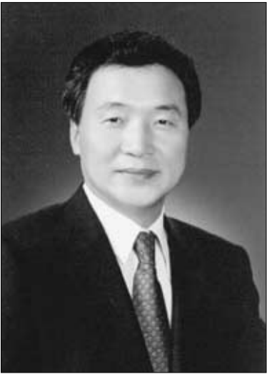
손 학규 경기도지사

경기도는 2005년 새해를 경기10년을 준비하는 4대 인프라 구축 사업과 언제나 살고 싶은 경기도 만들기에 적극 나서기로 했다. 4대 인프라 사업은 민생경제 활성화와 첨단산업 인프라 육성, 공교육 내실화와 글로벌 인재양성 인프라 구축, 어린이와 이웃을 배려하는 복지인프라의 지평 확대, SOC 확충 및 도민생활 안전 인프라 구축 등이다.