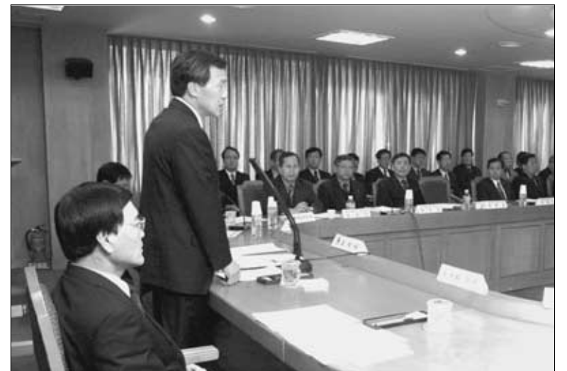
지역경제 활성화 간담회.