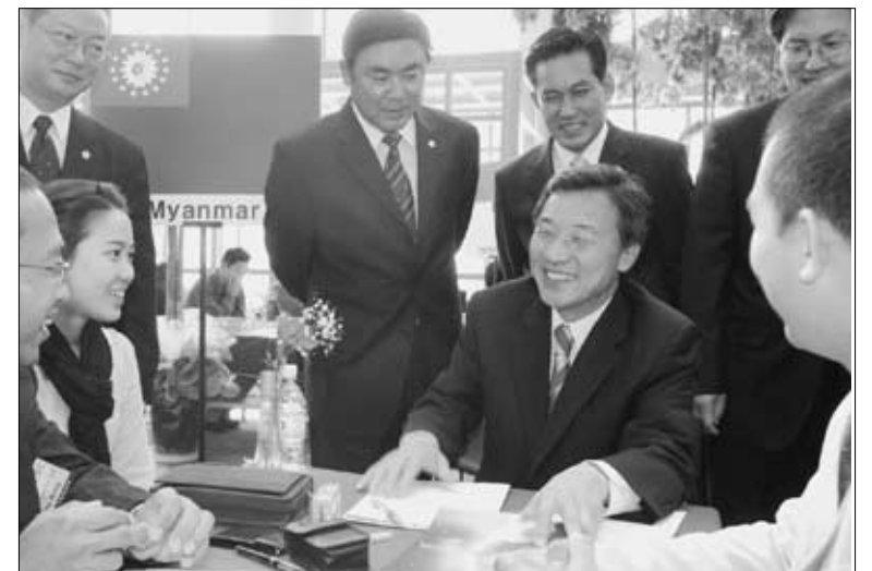
경기IT, 전기전자 수출상담회.