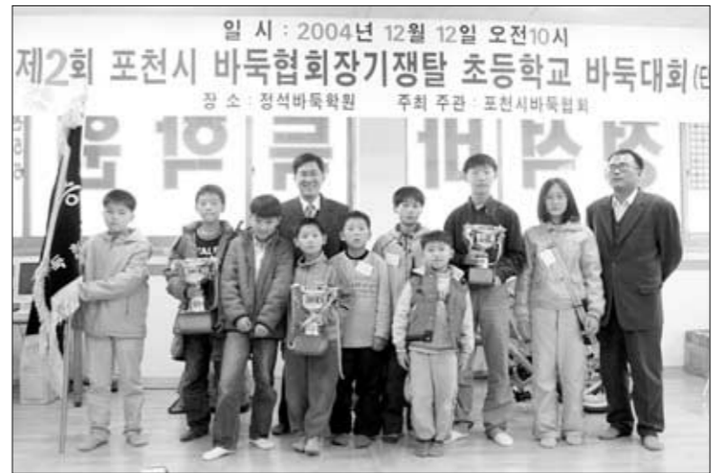
지난 12일 포천정석바둑학원에서 열린 '포천시 바둑협회장기쟁탈 초등학교바둑대회'가 열려 열띤 경쟁이 펼쳐졌다.