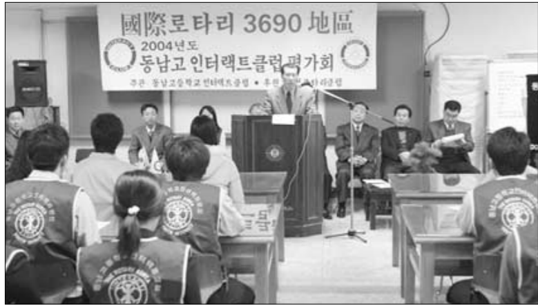
동남고등학교 인터랙트클럽은 지난 18일 학교 2층 독서실에서 2004년 동남 인터랙트클럽 평가회를 가졌다.

지난 18일 동남고등학교 2층 독서실에서 로타리클럽 관계자와 교사 및 학생 50여명이 참석한 가운데 2004년 동남 인터랙트클럽 평가회를 가졌다.