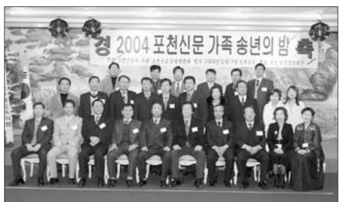
본지 가족송년의밤을 주관한 운영위원들이 기념촬영을 하고 있다.