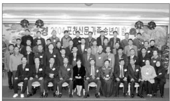
포천신문 조사위원회가 정론지 제작을 위해 다양한 방법으로 뉴스를 발굴할 것을 다짐하고 있다.