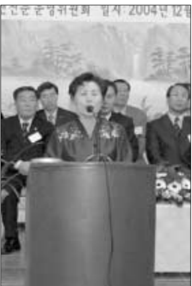
김기호 주부명예기자단이 기념사를 하고 있다.