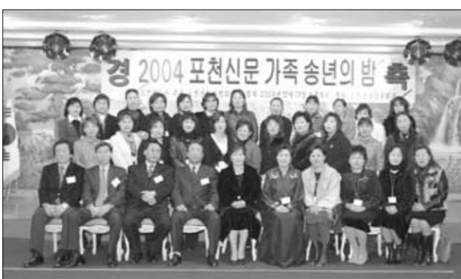
포천신문 주부명예기자단이 밝고 투명한 소식 전달에 앞장설 것을 다짐하고 있다.