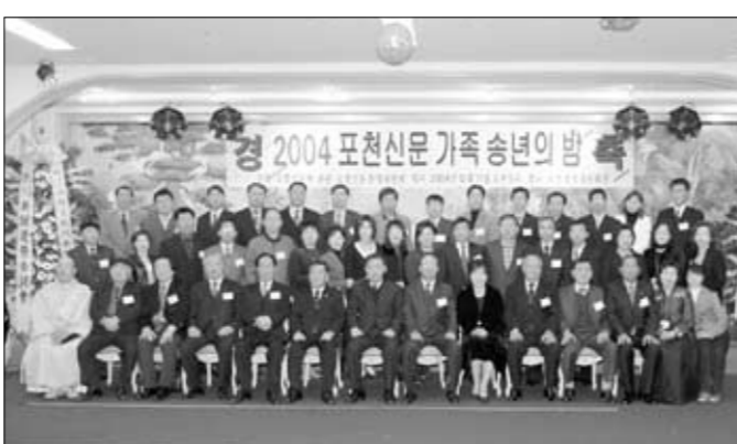
본지 송년의밤에서 수상한 가족들이 한자리에 모여 기념촬영을 하고 있다.