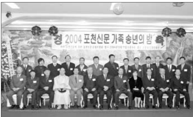
2004 포천신문가족송년의밤 포천신문 자문위원회 기념촬영.