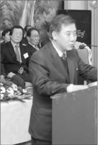
박윤국 포천시장이 축사를 하고 있다.