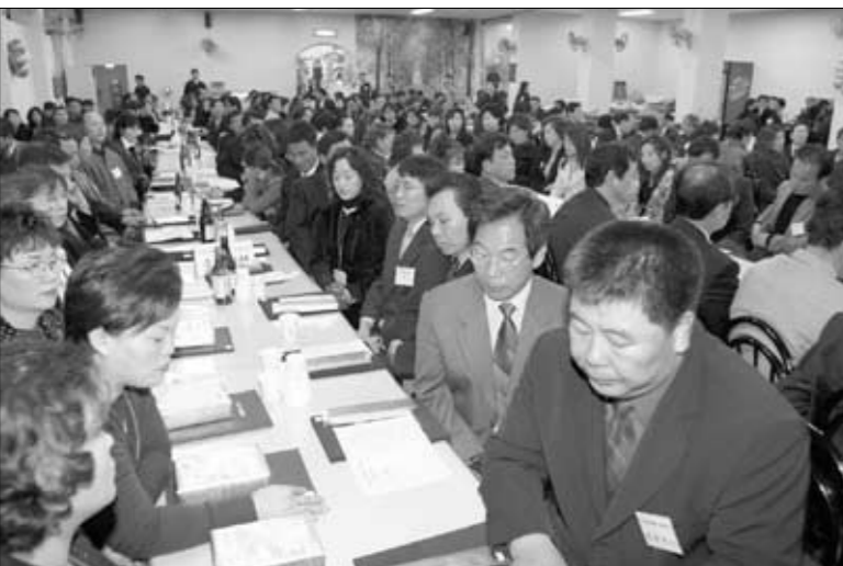
포천 용정웨딩홀을 가득 메운 내빈들.

2004 포천신문 가족 송년의 밤 행사가 지난 17일 오후5시30분부터 용정웨딩홀에서 400여명의 포천신문 가족이 참석한 가운데 개최돼 재창간 4년만에 포천신문 가족 모두가 한 자리에 모이는 계기를 마련했다.