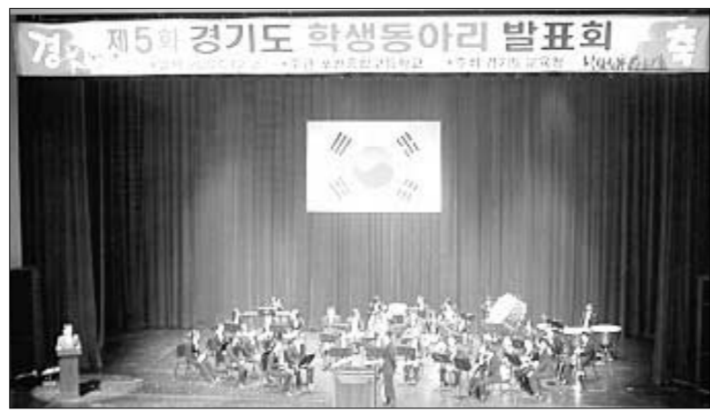
지난 2일 포천반월아트홀에서 개최된 제5회 경기도 학생동아리 종합발표회에서 포천중고 관악부 학생들이 Ross Play를 연주하고 있다.