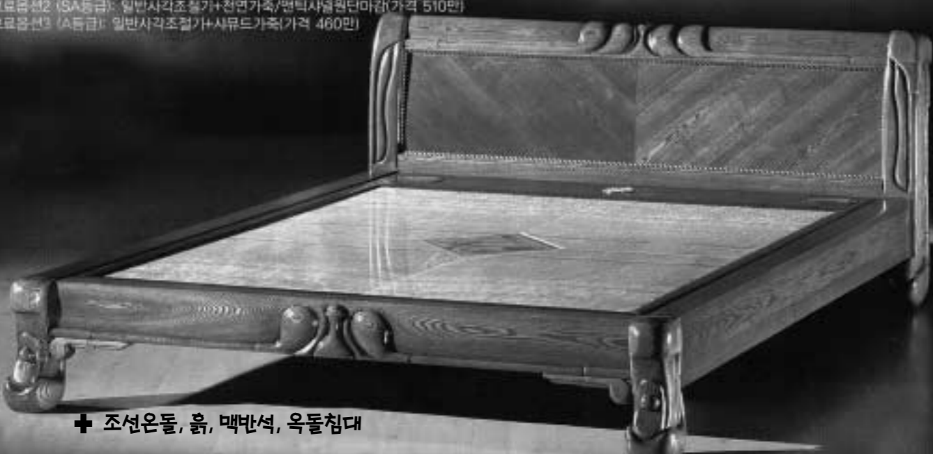
☞ 조선온돌, 흙, 맥반석, 옥돌침대