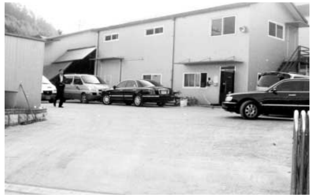
차별화된 캐스터 생산에 박차를 가하고 있는 동양금속(주) 전경.