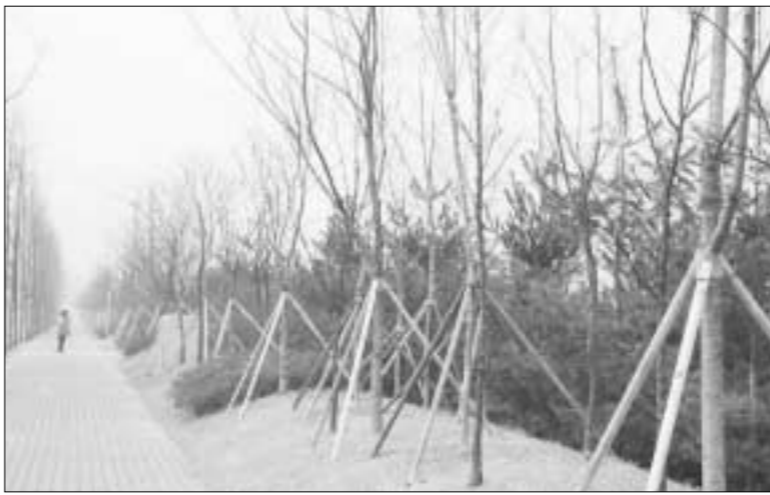
의정부시는 부용천환경개선사업의 일환으로 부용천을 단계별로 나누어 녹지대에 왕벚나무 등 다수의 수목을 식재, 꿈과 희망이 있는 시민의 쉼터로 가꾸기 위한 사업을 추진하고 있다.