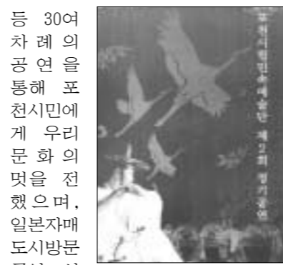
12월5일 포천반월아트홀대극장에서 개최되는 2004 포천시립민속예술단 제2회정기공연 포스터.

지난해 시 승격과 함께 창단된 포천시립민속예술단은 그동안 부모님과 함께하는 효도공연, 청소년 문화 예술 봄소풍 잔치, 청소년 체험학교