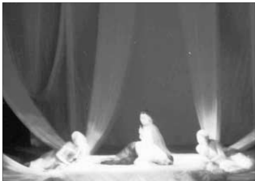
경북중학교 연극부 '위자료' 공연 모습.