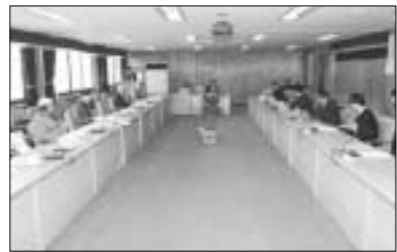
지난 22일 포천시청 소회의실에서 문화예술발전기금운영심의위원회를 개최했다.

포천시는 지난 22일 포천시청 소회의실에서 문화예술발전기금운영심의위원회를 개최하고 2005년도 문화예술발전기금사업 대상자를 선정했다.