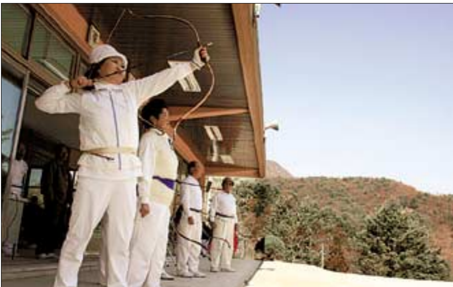
제1회 포천시체육회장기 궁도대회에 참가한 여무사들이 '관중(貴中)'을 위해 힘차게 활시위를 당기고 있다.