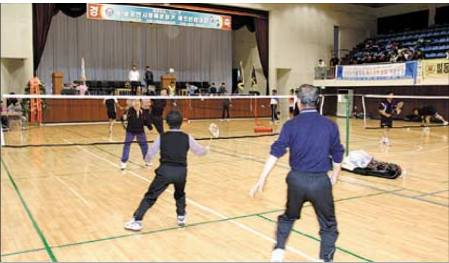
포천종합체육관에서는 지난 7일 224팀 300여명이 참가한 가운데 제2회 포천시 체육회장기 배드민턴대회가 열렸다.