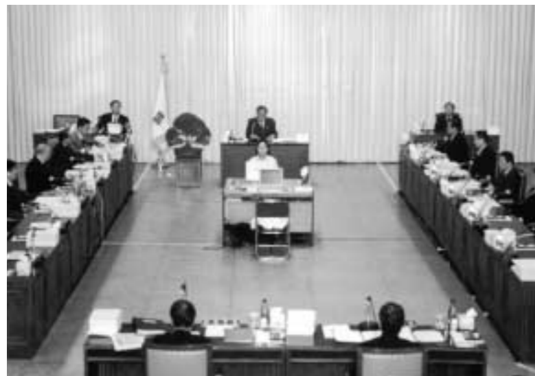
경기도교육위원회는 10월 25일부터 11월 1일까지 제3회 추경예산안을 심의했다.

경기도교육위원회에서는 정기회 기간중 지난달 15일 제1차 예산·결산소위원회를 시작으로 10월 25일부터 11월 1일까지 경기도교육청에서 제출한 2005년도 본예산안과 2004년도 제3회 추경예산안을 심의했다.