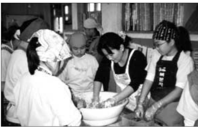
주5일수업제 선도학교 추산초등학교 학생들이 요리부 실습을 하고 있다.