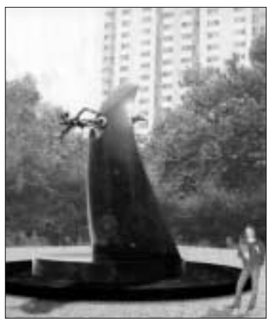
송우택지개발지구 4블록 영화아파트에 들어서게 될 조형물 설치조감도.