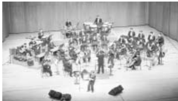
조영남과 노사연, 모스틀리 팍스오케스트라가 24일 포천반월아트홀에서 공연을 펼친다.

성악을 전공하다 대중가수로 진로를 변경해 대중의 큰 사랑을 받는 두 명의 가수가 기특하게 콘서트를 연다. 주인공은 바로 조영남과 노사연, 이들이 펼치는 2시간동안의 소리의 향연이 24일 오후 7시 30분 포천 반월아트홀 대공연장에서 열린다.