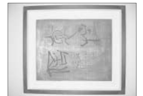
묵문 홍인봉의 작품 '포주신'