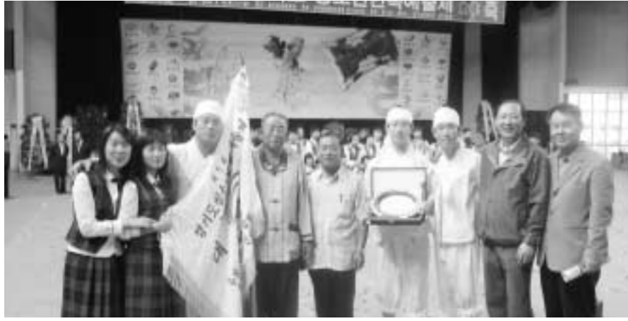
‘포천메나리 농악놀이’ 팀이 제5회 경기도 청소년 민속예술제에서 영예의 대상을 수상했다.

청소년들로 구성된 ‘포천메나리 농악놀이’ 팀이 지난 16일과 17일 이틀 간에 걸쳐 열린 제5회 경기도 청소년 민속예술제에서 영예의 대상을 수상하는 쾌거를 이루었다. 청소년들이 우리민족문화의 정서가 담긴 전통민속예술을 직접