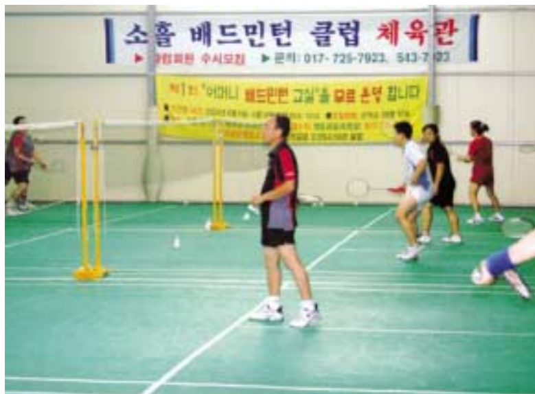
소흘읍에 거주하는 배드민턴 동호인들이 포천읍 동교동에 있는 사설 체육관에서 월 140만원의 임대료를 내고 운동을 하고 있다.

소흘읍 배드민턴 동호인들은 이 설치한 체육관에서 운동을 함으로써 막대한 경비를 부담하는 공간이 없어 인근 지역이나 개인