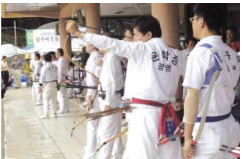
포천시에서 개최된 제15회 경기도지사기 생활체육대회가 폭우 속에도 불구하고 3일간의 일정을 모두 마쳤다. 사진은 포천시가 우승을 차지한 궁도 경기모습.

제15회 경기도지사기 생활체육대회 13일 閉幕 抱川市 테니스와 궁도 우승 개최지 저력 과시