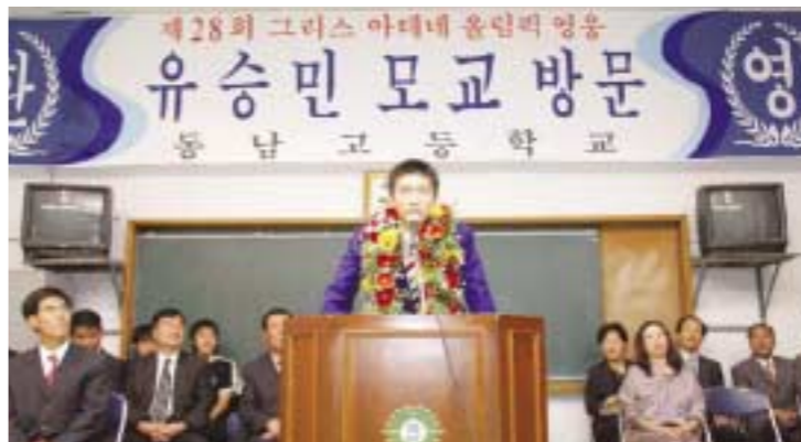
11일 동남고를 방문한 유승민 선수가 학교관계자 및 포천시탁구협회관계자, 학생들의 환영에 답사를 하고 있다.

제15회 경기도 생활체육대회가 열린 11일 오후 동남고등학교(교장 조대행)에 아테네올림픽 탁구 금메달리스트인 유승민선수(22)가 방문했다.