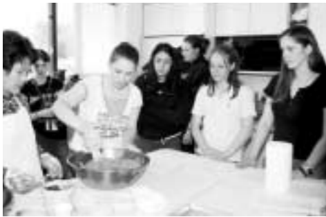
의정부시농업기술센터가 '주한외국인여성과의 문화교류사업'을 펼치고 있다.

의정부시농업기술센터는 지난 2일부터 16일까지 경기도 주최로 경기북부에 거주하는 외국인여