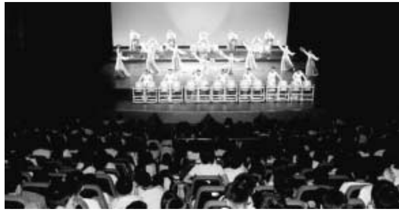
의정부시무용단이 의정부예술의전당에서 호원중학교 학생들에게 맞춤형 공연을 선보이며 우리문화의 우수성을 입증했다.