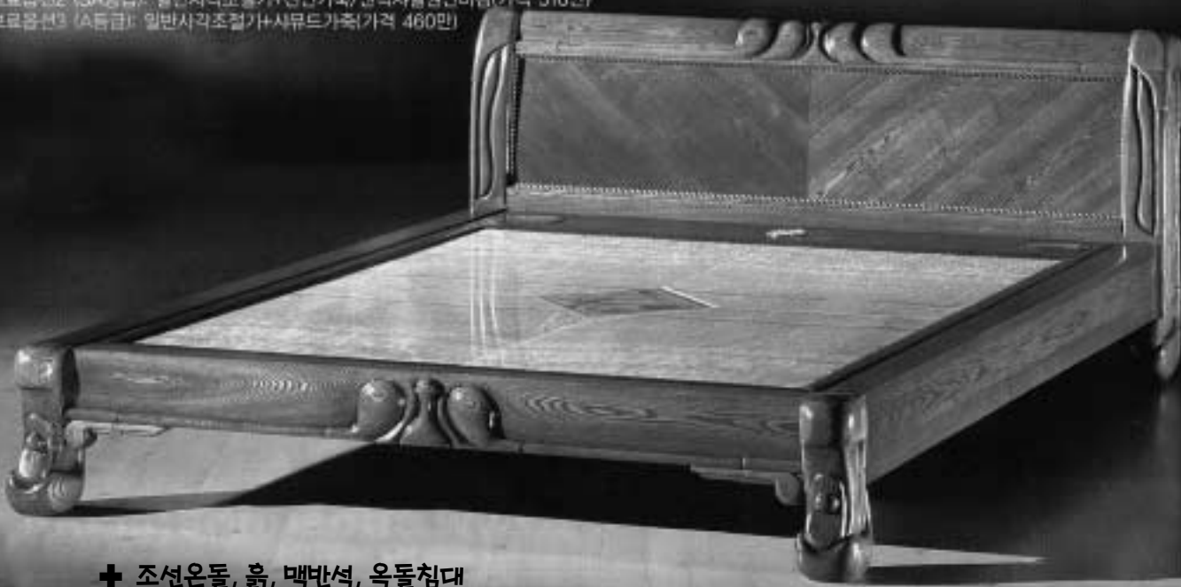
조선온돌, 흙, 맥반석, 옥돌침대