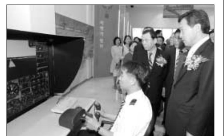
▲ 손학규 경기도지사 항공우주센터 개관식 참석 손학규 경기도지사는 지난 15일 오전 항공대학교에 세워진 항공우주센터 개관식에 참석, “이곳에서 연구되는 높은 기술을 통해 실제로 동아시아의 중심이 될 수 있는 계기가 되기를 바란다”고 말했다.