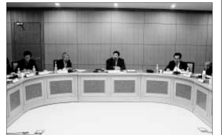
▲ 천명수 행정2부지사, 동두천시 주한미군재배치 관련 대책협의 천명수 행정2부지사는 11일 경기도청사에서 동두천시 주한미군 재배치에 따른 대책을 협의했다. 이날 회의는 주한미군 재배치가 지역에 미치는 영향을 최소화하고 동두천지역 경제활성화 대책을 강구하기 위한 대책의 일환으로 마련됐다.