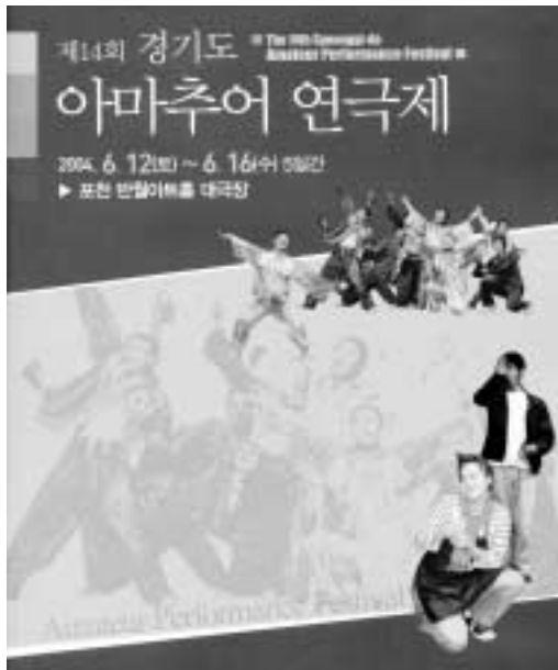
한국예총 경기도연합회와 포천시 공동주최한 제14회 경기도 아마추어 연극제가 지난 12일부터 16일까지 포천 반월아트홀 대극장에서 도내 23개팀이 참가한 가운데 개최됐다.

이날 대회 대상은 부천시 극단 열무에게 돌아갔다. 극단 열무(대표 최정필)는 정세혁 작 '보고 싶습니다' 작품을 열연했다.