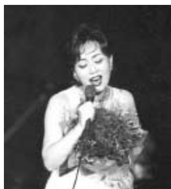
“불우이웃도 돕고, 흥겨운 노래 마당도 참가하고...”

‘불우이웃돕기 하춘하孝 콘서트’가 다음달 3일 오후 3시와6시 포천반월아트홀 대공연장에서 펼쳐진다.