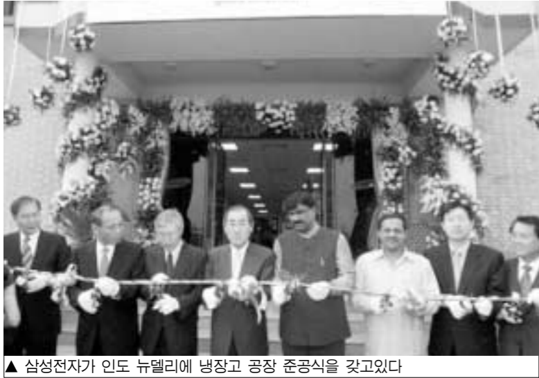
▲ 삼성전자가 인도 뉴델리에 냉장고 공장 준공식을 갖고있다

포천시가 관내 제조업 및 수출업체들의 해외마케팅활동을 지원하기 위해 남아시아 시장개척단 참가업체를 모집한다. 품목 제한은 없으며 참가를 희망하는 업체는 신청서와 상담 희망품목 명세서를 이달 30일까지 포천시청 지역산업과 기업지원부서에 제출하면 된다. 참가신청서는 포천시청 홈페이지(www.pcs21.net) '새소식'란에서 내려 받을 수 있다. 포천시는 희망업체 가운데 열 곳 정도를 선정해 9월 중 인도 뉴델리와 첸나이, 그리고 방글라데시 대가로 파견할 예정이다.