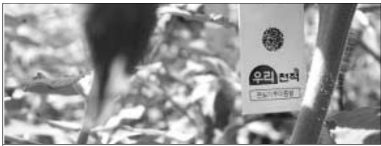
포천시 농업기술센터가 관내 동계기술을 보급해 눈길을 끌고 있다. 재배지역에 천적을 이용한 해충방제기술을 보급해 눈길을 끌고 있다.

를 들어 온실가루이 방제를 위해 농약을 사용하는 대신 천적인 "온실가루이좀벌"을 토마토 가지에 매달아 놓는 것을 말한다. 총 1천만 원의 비용이 소요되는 이번 사업을 통해, 주요발생 해충인 온실가루이, 총채벌레, 아메리카잎굴파리 등을 살충제를 뿌리지 않고 방제할 수 있게 됐다. 포천시 농업기술센터는, 재배기간동안 해충방제기술 컨설팅을 지속적으로 추진해, 안전농산물 생산을 위한 기반을 조성함과 동시에, 생산된 농산물의 친환경농산물 품질인증을 추진해 농가소득 증대에 이바지한다는 계획이다. 농업기술센터 관계자는, 21세기에는 친환경농업만이 살아남을 수