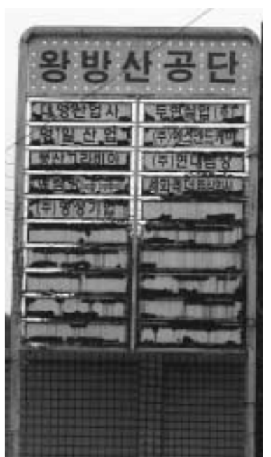
▲ 왕방산 공단 입구에 세워진 간판이 비바람에 훼손돼 있다.