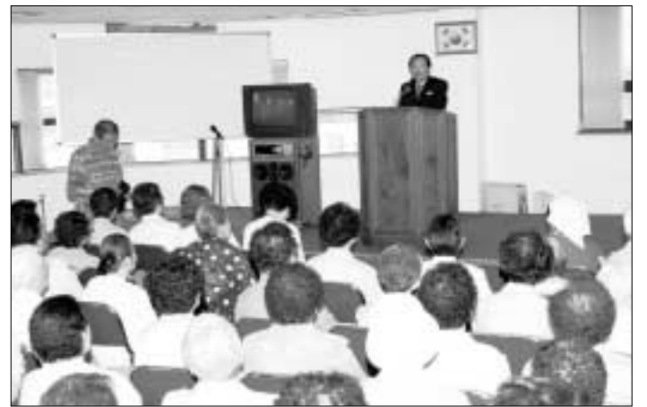
▲김문원 의정부시장 노인대학 특강 김문원 의정부시장은 2일 오전 가남2동 노인대학에 참석, 지역사회발전과 시정 전반에 대한 설명으로 특강을 실시하고 지역의 어르신으로서 지역사회발전을 위해 많은 고견을 해달라고 당부했다.