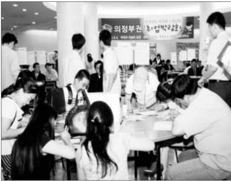
▲ 지난 4일 오후 의정부예술의전당에서 개최된 의정부권 취업박람회에 1천여명의 구직자들이 몰려 최근의 실업대란 사태를 반영했다.

의정부시는 최근 경기침체에 따른 실업사태가 예상되는 가운데 청년구직자와 구조조정실직자들의 취업을 돕기 위해 지난 4일 오후 의정부예술의전당에서 경기도 제2청, 의정부시고용안정센터와 공동으로 『의정부권 취업박람회』를 개최했다.