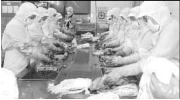
▲정산김치공장 수출라인 설치사업 실시 전국농협은 해마다 소비가 늘고 있는 김치수요에 대비하기 위해 총 20여억원의 사업비를 들여 정산김치공장 수출라인 설치사업을 실시할 계획이다.