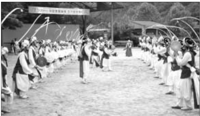
▲ 동두천 이담풍물놀이 보존회(회장 천재원)에서는 지난 30일 계절의 여왕 5월을 아워워하며 경기의 소금강 소오산 야외음악당에서 시장, 시의장, 예총회장, 관공, 시민 등 500여명이 참석한 가운데 이담풍물놀이 정기 발표회를 개최 했다.