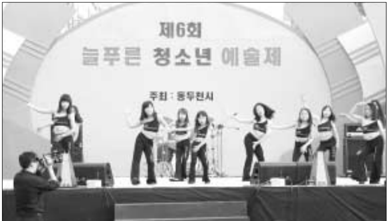
▲ 동두천시는 지난 29일 신시가지 차 없는 거리 특설무대에서 시장, 시의장, 문화예술회원, 시민, 청소년 등 1,000여명이 참석한 가운데 청소년 예술제를 개최했다.