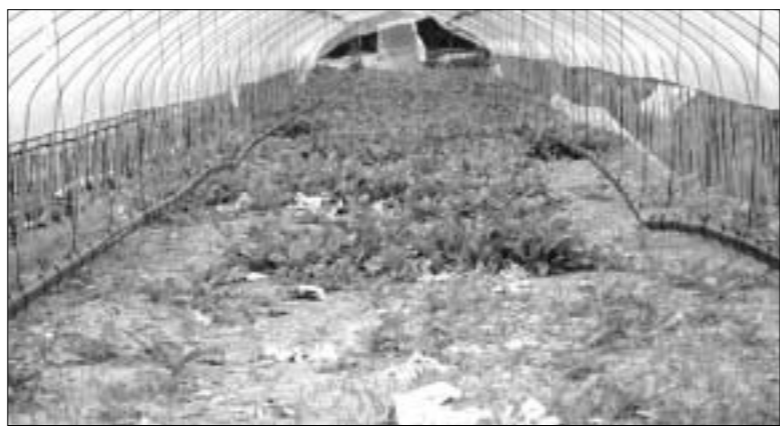
▲밭떼기로 넘겼으나 출하지 않고 방치되어 있다.