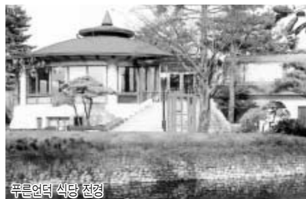
푸른언덕 식당 전경