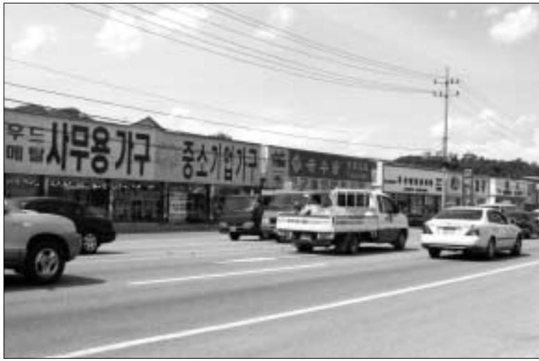
송우가구단지가 브랜드화 사업을 통해 새롭게 탈바꿈하여 이곳을 찾는 고객들의 만족도를 높여

의 우수성을 널리 알리고 활기찬 상거래 활동을 유도하기 위해 가구단지 브랜드화 사업을 추진키로 했다.