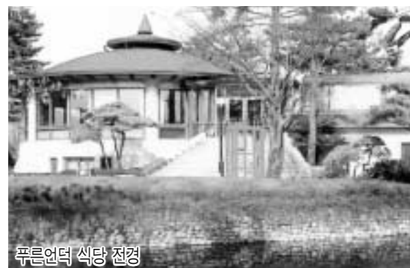
푸른언덕 식당 전경