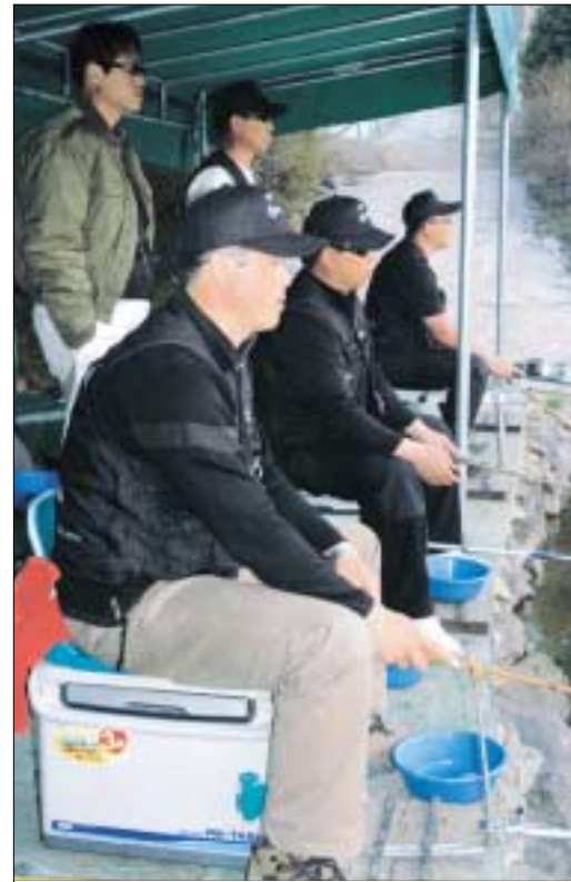
▲은 정신을 집중해 연습하고 있는 회원들.