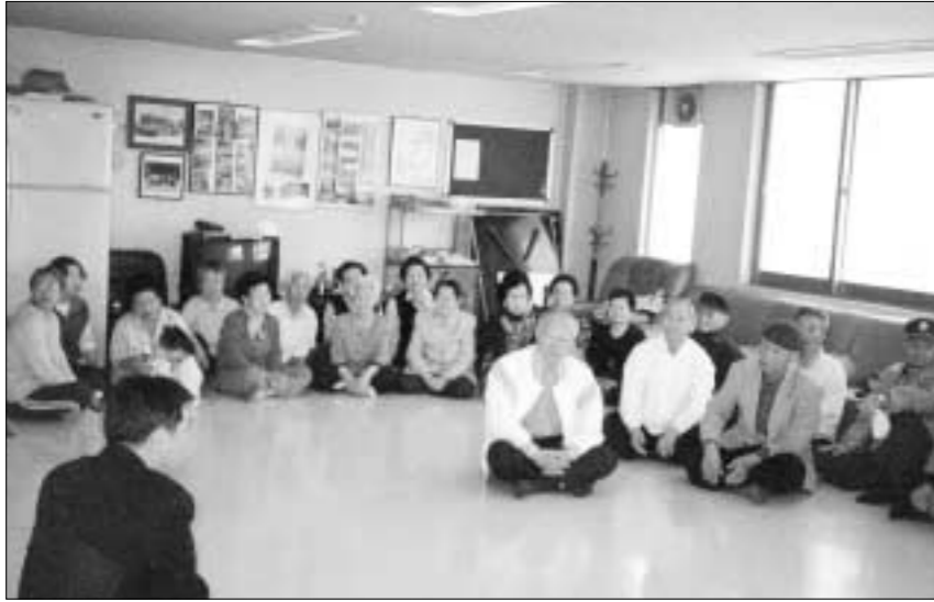
▲상운아파트 주민들과 대화를 나누고 있는 박윤국 포천시장은.

지난 9일 포천시 소흘읍 상운아파트 주민들은 박윤국 포천시장을 초청해 간담회를 가졌다.