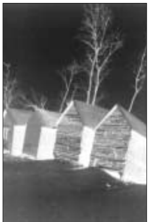
△ 이 작家的 작품 '방갈로'

마지막으로 그에게 사진을 잘 찍는 방법을 묻자 "왕도가 없다"는 대답이 바로 돌아왔다. 비결은 그저 많이 찍어 보는 것 밖에 없다는 얘기다.