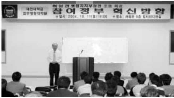
허성관 행자부장관이 대진대에서 강의를 하고 있다.

허성관 행정자치부장관은 “참여정부의 혁신은 발상의 전환과 지금까지 했던 것을 복습하는 것으로 출발해 건전한 비판을 수용하는 것과 시간과 돈, 사람을 덜 투자하는 것”이라고 밝혔다. 허 장관은 11일 오후 7시 대진대학교 사회과학관 5층 멀티미디어실에서 대진대학교 법무행정대학원생과 박기춘 국회의원, 최태중 포천시의회위원장, 변진수 포천교육장과 지방자치단체 공무원 등 200여명이 참석한 가운데 정부혁신의 전략과 이해라는 주제로 실시한 특강에서 이같이 밝