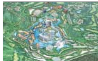
백운 클라우드 밸리