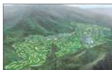
블루 골프 리조트