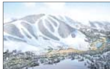
블루 스키 리조트