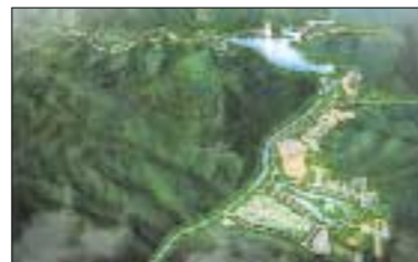
산정 레이크 타운