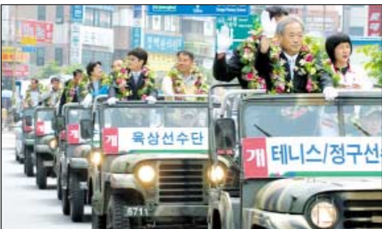
경기도 체육대회 포천시 선수단 해단식 제53회 경기도 체육대회에서 7연패의 위업을 달성한 포천시 선수단을 환영하는 커피퍼이드와 해단식이 6월5일 오후 포천시 신용동 및 소흘읍 송우리 일원과 포천빈윌트홀에서 개최됐다.