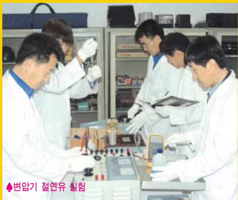
▶변압기 절연유 실험