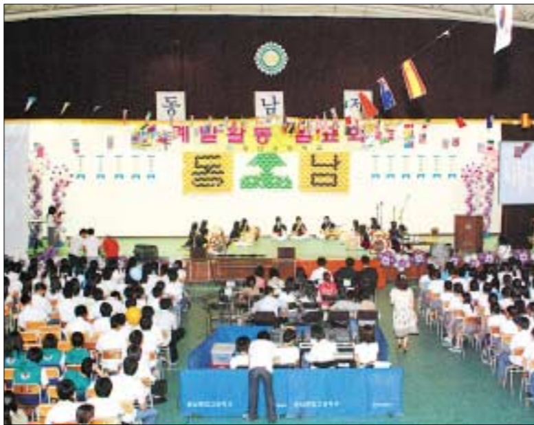
1956년12월28일 인가를 받아 50년 동안 중학생 8천613명, 고등학생 7천459명 등 1만6천72명을 배출한 학교법인 동인학원 동남중학교 · 동남고등학교 개교 50주년 기념축제는 9월28일 동남중 · 고등학교 운동장에서 개최된다.