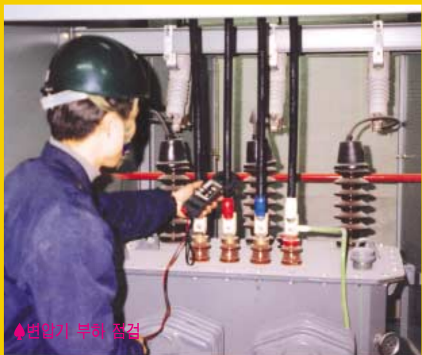
▶변압기 부회 점검