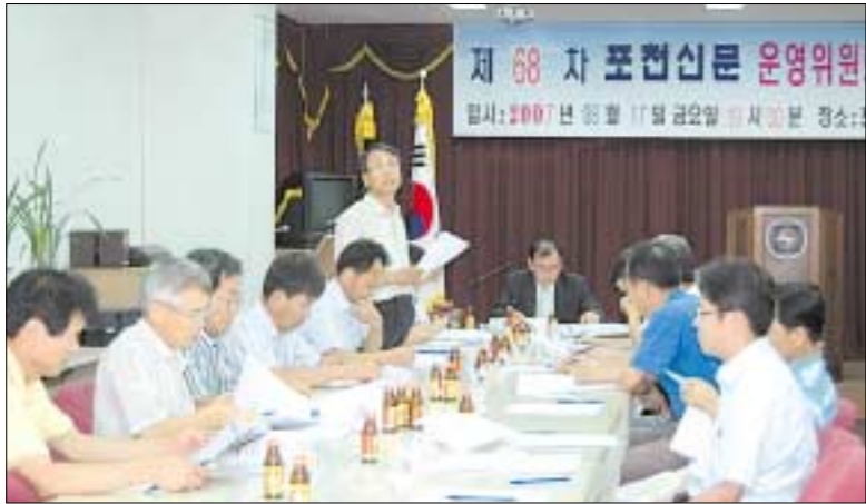
포천신문 운영위원회 제68차 정기회의가 8월17일 본사 대회의실에서 개최됐다.