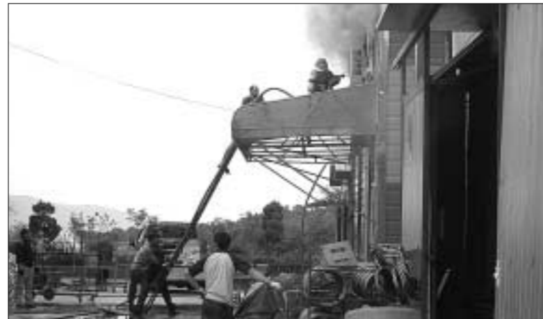
지난 11일부터 18일까지 포천지역에서 5건의 화재가 발생해 1억3천3천500만원의 재산피해가 발생했다고 포천소방서가 밝혔다.