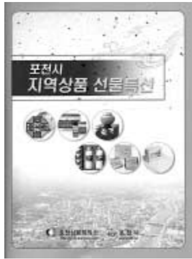
포천시와 포천상공회의소가 추석 대목을 겨냥해 지역 내 54개 중소기업의 생산 제품들을 수록한 카탈로그를 발간했다.

기업하기 좋은 도시를 지향하는 포천시와 포천상공회의소가 추석 대목을 겨냥해 지역 내 54개 중소기업의 생산 제품들을 수록한 카탈로그 2,000부를 발간했다.