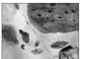
▲김혜정작 '식물의 사유-비림' (acrylic on canvas)