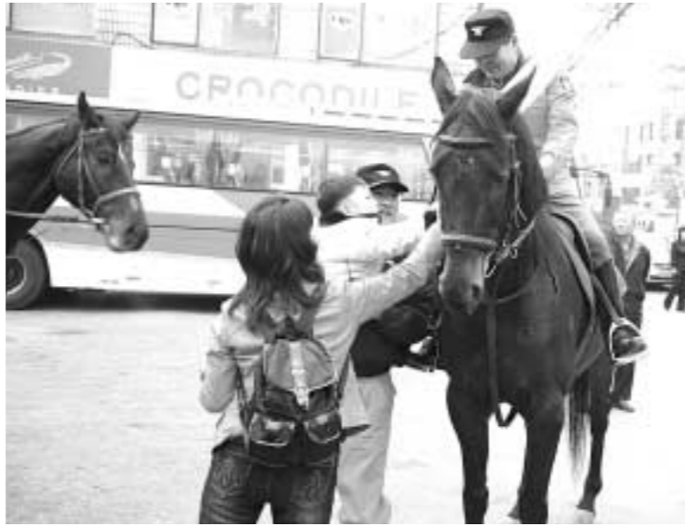
포천소방서는 11월14일 10시부터 포천시내 신읍동 일원을 복제(기동복, 모자, 어깨띠)착용 후 소방차(홍보차·화물차·달 3벌·군내 1벌프·물탱크·구조공작·화확차순)와 함께 퍼레이드행사를 펼쳤다.

원들의 모습과 함께한 소방차들의 퍼레이드가 시민들에게 화재예방의식을 심어주는 시각적이고 입체적인 홍보 효과를 얻었다고 전했다. 119기마순찰대는 불조심 강조의 달 및 겨울철 소방안전대책기간 중 관내 다중이용집중장소 등 2007년 전국 불조심 강조의 달 및 2007년 겨울철 소방안전대책 추진과 연계한 단력적 운영으로 안전사고 예방 계도·홍보활동을 펼칠 계획이다. 김영복 기자 best114@paran.com