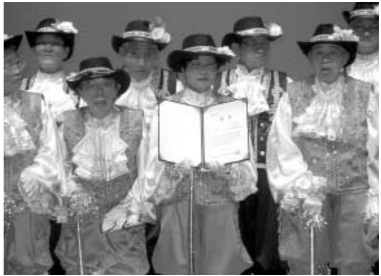
전남 목포에서 개최된 제2회 전국노인건강대축제에서 포천자혜원팀이 시설체조부문 대상을 수상했다.

10월12일과 13일 이틀간 목포 문화예술회관에서 열린 노인건강대축제 시설체조부문에는 전국에서