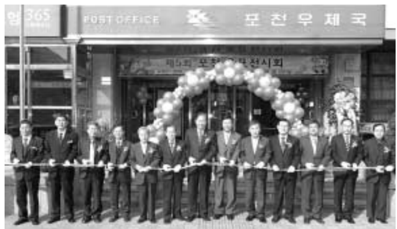
포천우체국과 포천우취회가 마련한 제5회 포천우편전시회가 11월19일부터 22일까지 4일간 포천우체국 1층 전시실에서 개최된다.

넘기기가 어렵다고 했는데 아직도 살아 있습니다.” 그러자 의사는 결 결 웃으면서 이렇게 대답하는 것이다. “그렇게요. 이제 곧 부인은 아기를 가지게 될 것입니다. 부인이 아기를 못 가지는 것은 부인의 몸이 너무 비대하기 때문이었습니다. 살을 빼야 아기 가질 수 있을 텐데 그러려면 어쩔 수 없이 충격요법이 필요했습니다. 그래서 제가 일부러 염포를 놓은 것입니다.” 사람은 마음으로 비탄(거만)하면 사람을 살리지 못하고, 오히려 생명을 죽이는 일만 할 뿐이다. 자기 자신에게 엄격하지 못하면 우리의 헛된 교만만 키치게 된다. 우리에게서 이런 교만, 위선의 삶, 탐욕의 삶을 빼버리자. 그래서 성서는 이런 교훈을 주신다. 잠언서 16장18~19절에 “교만은 패망의 선봉이요 거만한 마음은 넘어짐에 앞장서나니. 겸손한 자와 함께 하여 마음을 낮추는 것이 교만한 자와 함께 하여 탈취물을 나누는 것 보다 나으니라”고 가르치신다. 문의) 031-532-2489