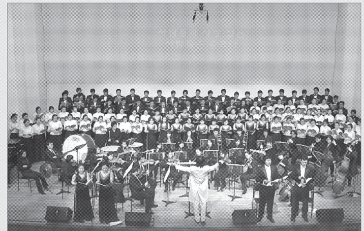
동두천시립합창단 제6회 정기연주회가 12월12일 오후 7시30분 시민회관 공연장에서 개최됐다.