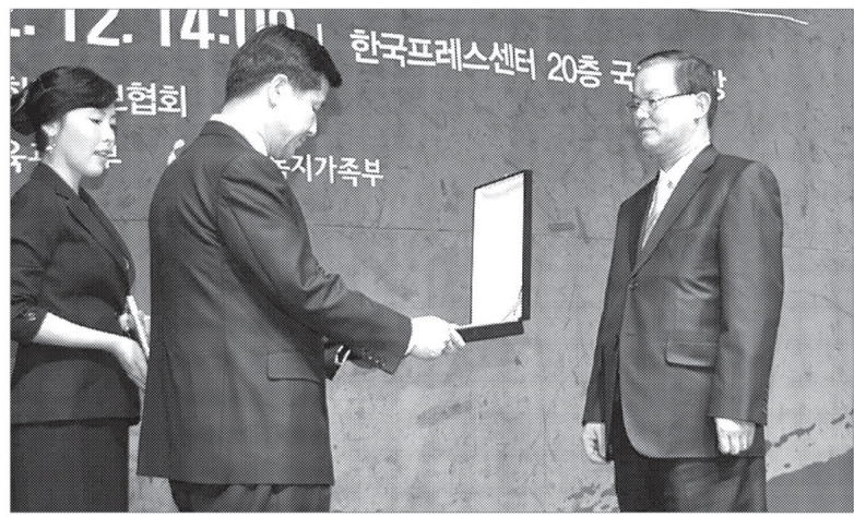
양주시가 발행하는 시정소식지 '함께 그린양주'가 지자체 소식지 중 3년 연속 최우수 평가를 받았다. '함께 그린양주'는 행정기관에서 제작하는 편린일률적인 시정소식지와 달리 남녀노소 누구에게나

2008년 국내 최고 권위의 커뮤니케이션 제작물 콘테스트인 2008 대한민국 커뮤니케이션 대상에서도 지자체 소식지 중 최고 점수를 받은 '함께 그린양주'는 시민중심형 눈높이에 맞는 정보전달 서비스가 시민들로부터 매우 좋은 반응을 얻어내고 있음을 의미한다.