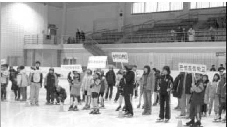
경기도동두천양주교육청은 제13회 동두천양주교육청 교육장배 초중학생 빙상대회를 의정부 실내빙상장에서 개최했다.