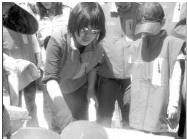
연천군농업기술센터는 민족의 명절 설을 맞이하여 외국인 주부와 자원 봉사자등 50여명을 대상으로 2월2일 목계전통테마 마을에서 한국에서 설을 식 만드는 법을 배우고 우리의 고유 명절을 배우면서 즐거운 한때를 보냈다.

족 봉사대원들과 결연을 맺고 외국인 주부들의 생활을 도와주기로 했다. 기술센터 관계자는 "차질 타국에서 더욱 외로움을 느낄 수 있는 외국인 주부들이 한국의 음식과 명절문화 등을 보고 느끼면서 즐거워하는 모습이 보기 좋았다"고 밝혔다. 김영복 기자 best114@paran.com