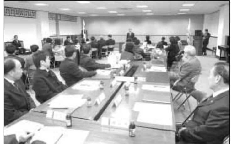
양주시는 양주시주민참여예산제운영조례가 제정공포 됨에 따라 예산편성과정에 참여할 예산참여시민위원회 위원을 구성하고 운영에 들어간다.

양주시는 양주시주민참여예산제운영조례가 제정공포 됨에 따라 예산편성과정에 참여할 예산참여시민위원회 위원을 구성하고 운영에 들어간다. 시가 추진하는 양주시 예산참여시민위원회는 예산편성 과정에 지역주민이 함께 참여하여 지방재정 운영의 투명성과 공정성 및 효율성을 제고하고 재정민주주의 실현과 폭 넓은 재정차지를 실현하는데 목적이 있다. 예산참여시민위원회 구성은 4개 분과 24개부서 46명으로 구성되었으며 분과별로는 자치행정 7개부서, 주민생활 7개부서, 지역개발 5개부서, 도시교통 5개부서이다. 위원회의 주요 기능은 ▶예산편성에 대한 주민들의 의견 수렴 및 집약하는 활동 ▶주민들을 대상으로 예산에 대한 교육·홍보 활동 ▶보고회 및 정책토론회 개최 등에 관한 활동 ▶예산절감을 위한 연구 활동 등이다. 위원회는 위원장 1인, 부위원장 1인, 간사 1인, 서기 1인을 두며 위원회 개최는 매월1회 정기운영과 예산편성 기간 중에는 수시로 운영하게 된다. 김영복 기자 best114@paran.com