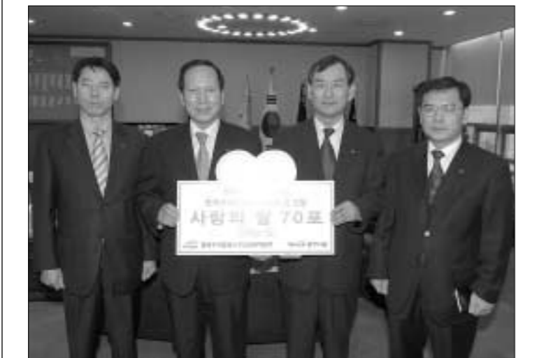
한국수자원공사 수도권지역본부와 양주시는 1월7일(월) 오후 2시 30분 양주시 독거노인 등 저소득 주민 70가구에 월동식량을 지원하는 '사랑의 쌀 나누기' 행사를 가졌다.