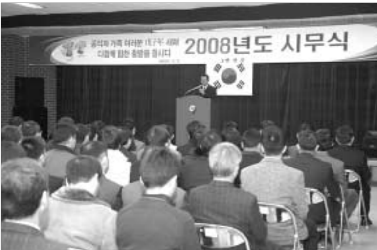
연천군은 2일, 본관 3층 대회의실에서 직원 200여명과 함께 '2008년 시무식' 행사를 개최했다.