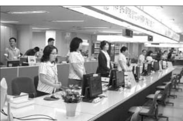
연천군은 지난해 12월26일부터 언제 어디서나 누구를 마주쳐도 웃으며 인사하고 고객에게는 최상의 감동서비스를 제공하기 위해 '3Step 운동'을 전개하고 있는데, 교육 및 홍보효과를 높이기 위해 '3Step(Sam Step)' 1일 친절교육 CD를 제작한다고 밝혔다.