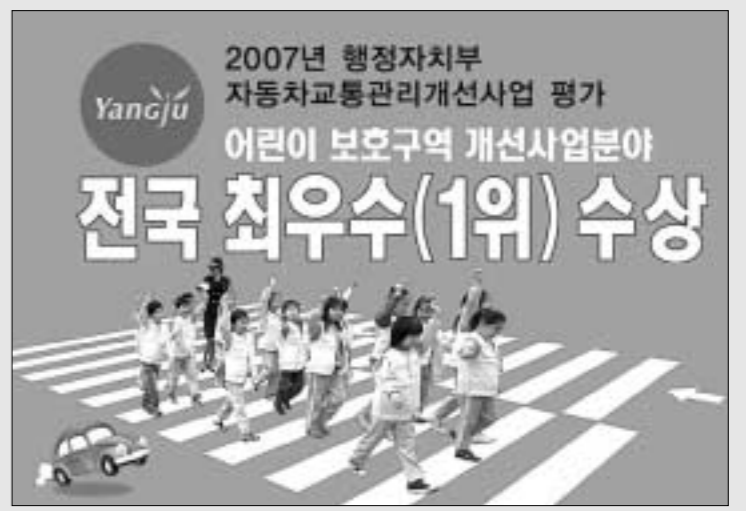
행정자치부가 전국적으로 추진하는 2007년도 자동차교통관리개선사업 평가결과 어린이보호구역개선사업 분야에서 양주시가 전국 최우수(1위) 기관으로 선정되어 인센티브 사업비 10억을 지원받는다.

특히 5개 초등학교에 시범적으로 설치한 '말하는 CCTV' 특수시책이 학교 관계자들로부터 좋은 반응을 얻자 양주시에서는 전국 최초로 모든 초등학교에 확대 추진키로 하였으며 이는 지난해 12월4일 9시 MBC뉴스데