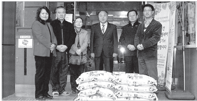
의정부시 그림사랑동우회는 전시회 작품을 판매한 수익금 전액을 어려운 이웃에 써달라며 의정부1동 주민센터에 기탁했다.