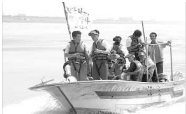
김문수 경기도지사가 8월17일 한강 하구 일원에서 열린 한강하구 뱃길탐사에서 한강 수중보와 정황 습지를 살펴본 후 일산대교 방향으로 이동을 하며 현장 탐사를 하고 있다.

신곡리 수중보~장항습지~일산대교~하성면 전류리까지 16km를 이동한 뒤, 이어 11km 떨어진 조강포까지 버스를 이용해 한강 하류 일대를 세심히 살폈다. 이번 뱃길탐사에서 역점을 둔 부분은 한강하구 퇴적상향 및 한강제방 보강사업, 철책선 제거추진, 수중보 이전 등 주운수로 확보여건과 일산대교 신설에 따른 하상변동 상황을 살폈다. 이어 북한의 개포 땅을 불과 500여 미터 마주보고 있는 조강포의 복원 및 활용 가능성을 현장에서 점검했다. 침수피해 방지를 한강제방은 고촌면 신곡리~하성면 시암리 28.3km 구간을 보강한 뒤 10차로 규모로 도로를 건설하는 사업은 타당성 조사를 마치고 연말까지 기획 예산처, 건교부, 환경부 등과 협의에 들어간다. 특히 탄력을 받고 있는 한강철책