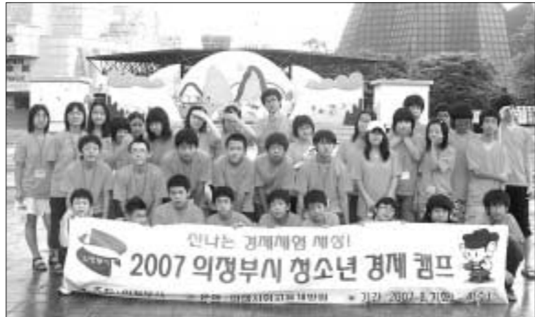
의정부시는 여름방학을 맞아 자라나는 청소년들의 경제교육을 위해 8월7일부터 8일까지 1박 2일 간의 일정으로 관내 중학생 40여명을 초청, 충남 청양 칠갑산 연수원에서 청소년 경제캠프 행사를 가졌다.

이번 경제캠프를 통해 돈과 경제에 대한 올바른 의미와 가치를 알고 경제관념에 대하여 정확하게 이해할 수 있는 경제체험의 장을 마련해 줌으로써 변화하는 세계경제 질서에 경쟁력을 확보하고 건전한 경제주체로 성장할 수 있는 기회를 제공하는데 기여했다. 한편 시는 처음으로 청소년을 대상으로 경제에 대한 캠프를 실시함으로써 미래의 경제 주체인 청소년 개인의 경제마인드에 대한 지식의 폭을 넓히는 것은 물론, 나아가 우리 지역의 경제발전에 주축이 될 수 있을 것으로 기대한다고 말했다. 김영복 기자 best114@paran.com