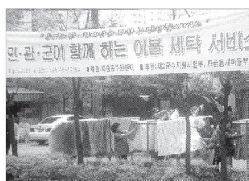
의정부시 자금융동은 독거노인과 장애인을 위하여 2군수지원사업부 16보급대대 장병들과 새마을부녀회원들이 참가한 가운데 이불세탁의 즐거운 시간을 가졌다.

한편 세탁서비스를 받은 독거노인 양희관씨는 노인들이 혼자 살면서 이불 세탁은 엄두도 내지 못했는데 이렇게 군인들이 직접 나서서 해 주어 감사하다고 말했다.