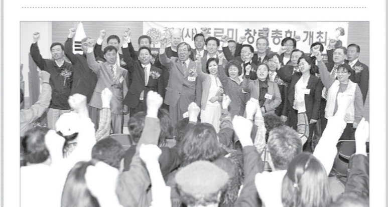
자연과 환경을 사랑하는 마음으로 결성된 푸르미 창립총회에 참석한 경기도 김문수 경기지사가 축사와 함께 푸르미회원들과 푸르미 창립선언문 비전 선포를 하고 있다.