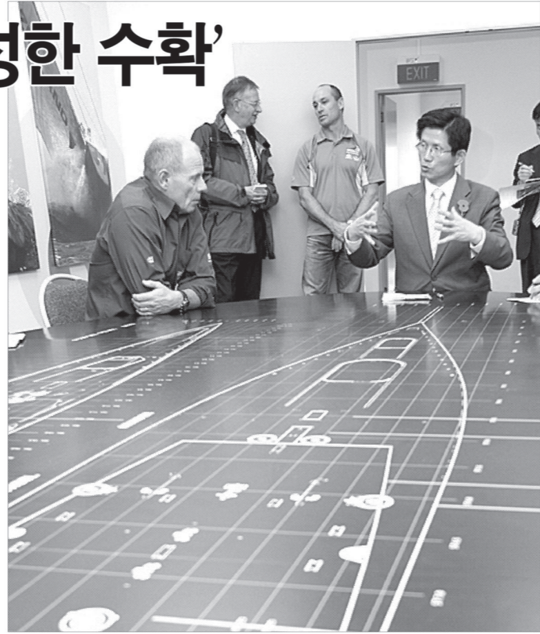
뉴질랜드를 방문중인 김문수 경기도지사가 4월24일 오클랜드에 위치한 뉴질랜드 요트클럽 빌딩을 방문해 이야기를 나누고 있다.

말산업 육성 측면에서도 큰 도움이 됐다. 호주는 2002시드니 올림픽에서 승마 종목을 해외 말들의