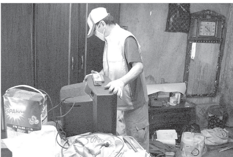
의정부시 송산노인복지회관은 올해 노인일자리사업 신규로 20명의 어르신이 참가하는 주거개선 사업단을 만들어 어려운 가정을 찾아가 전기, 수도, 도배, 장판 등을 수리 및 교체해 주는 사업을 추진하고 있다.

저소득 어르신들께 도배에 필요한 도배지, 풀 등 도배물품을 지원하고 싶으신 분이나 후원을 원하시