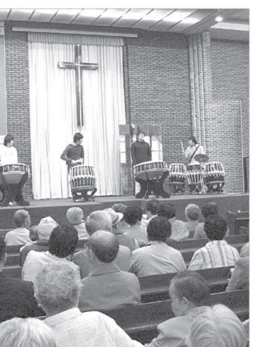
5월 가정의달을 맞아 신촌교회는 어렵게 살아 가고 계신 어르신 500여명을 초청해 성대한 효잔치를 개최했다.

5월 가정의달을 맞아 신촌교회(의정부시 가남1동 소재)는 어렵게 살아가고 계신 어르신 500여명을 초청해 성대한 효잔치를 개최했다.