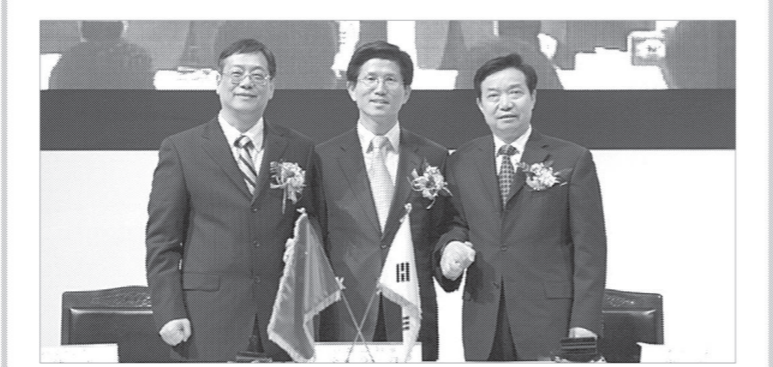
김문수 경기도지사는 4월28일 오후 2시 킨텍스 제2전시장에서 개최된 도자기의 날 선포식에서 '세계도자기 역사의 날' 선포식에서 '세계도자기 역사의 날'을 선포했다. '이 자리에 오신 각국 대사님들과 관계자 여러분이 도자발전과 국가간의 우의와 동독을 촉진할 힘을 증진시키는데 도자기 좋은 매개체가 될 수 있길 기대한다'고 밝혔다.