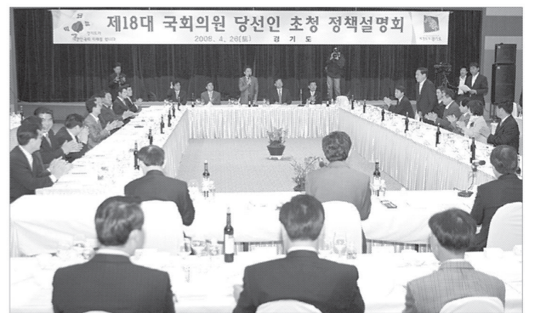
김문수 경기도지사는 4월26일 오후 6시 경기중소기업지원센터에서 도내지역 18대 국회의원 당선자 51명을 초청, 도정 설명회를 통해 규제개혁 실현 방안에 대해 논의했다.

권 규제(기업·대학규제) 개선 ▶팔당호 수질개선 근본대책 강구 ▶군사시설 보호구역 축소 ▶그린벨트는 그린벨트의 합리적 개선 ▶농지규제 완화 ▶물류단지 개발물량규제 폐지 ▶대규모 택지 및 도시개발사업 권한 지방이양 ▶택지주택 공급제도 개선 ▶경제자유구역 제도개선 ▶학교용지 매입비 부담제도 개선 ▶의국교육기관 유치촉진을 위한 과실승급 허용 ▶기초초령원 급법 시행에 따른 제도개선 ▶가정보육교사 제도의 법 제제화 ▶열악한 지방재정 해소를 위한 제도개선(일반현안 11건) ▶