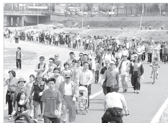
의정부시는 4월19일과 20일 건강체험 한마당, 'u-happynuri와 함께 합니다'란 주제로 중랑천 잔디광장에서 3천여명의 시민이 참여한 가운데 건강과 행복을 위한 축제를 개최했다.