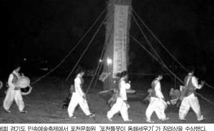
제16회 경기도 민속예술축제에서 포천문화원 '포천틀뚝이 동화세우기'가 장려상을 수상했다.

포천틀뚝이 동화세우기는 포천시 신북면 기리리 천주산 밑에 350년간 정착하여 거주하고 있는 유구한 역사와 전통을 자랑하는 틀뚝이 마을에 전해 내려오는 고유 전통 민속으로 유래대보를 다음날인 열흘새 귀산날에 동화를 세우고 마을의 귀신을 쫓고 재앙을 물리치며 항상 평온한 가운데 마을주민 모두가 민사행통하기를 기원하는 민속의식이다. 특히 이번 민속예술제는 개막식과 폐막식 축하공연으로 브라질 삼바춤, 우크라이나 벨리춤, 필리핀 대나무춤 등의 초청공연으로 불거리와 문화에 대한 새로운 인식을 갖게 하는 계기가 되었다.