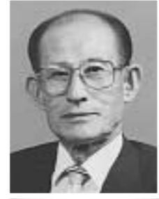
리효종 포천한시사 대표

송인수는 종종때 문과에 합격하고 정9품에 해당하는 홍문관 정자로 들어갔다. 당시는 기묘사화를 일으켰던 훈구파와 왕실의 외척들이 권력을 장악하고 있을 때였다. 따라서 선비들의 사기는 크게 떨어지고, 바른 말을 외워야 할 언관(言官)을 조차 권력자의 하수인으로 전락한 경우가 많았다.