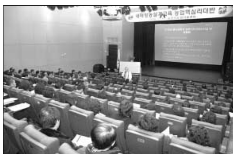
포천시농업기술센터는 지난 1월 8일부터 1월 29일까지 농업인 2,856명을 대상으로 '프로농업인이 희망농업을 만든다'라는 주제로 2008년 새해영농설계교육을 뜨거운 열기 속에 마무리 했다.

이런 교육은 벼농사를 비롯한 기초농업반, 공반, 쌀 혁신단지반, 포도반, 인삼반, 오이반, 고추반, 친환경 농업반, 농업기계반, 한우반, 농업핵심리더반, 생활개선반 등 13개 과정으로 진행 되었으며 벼농사반은 3개조로 편성된 교관반이 14개 읍면동을 대상으로 순회하며 실시했다.