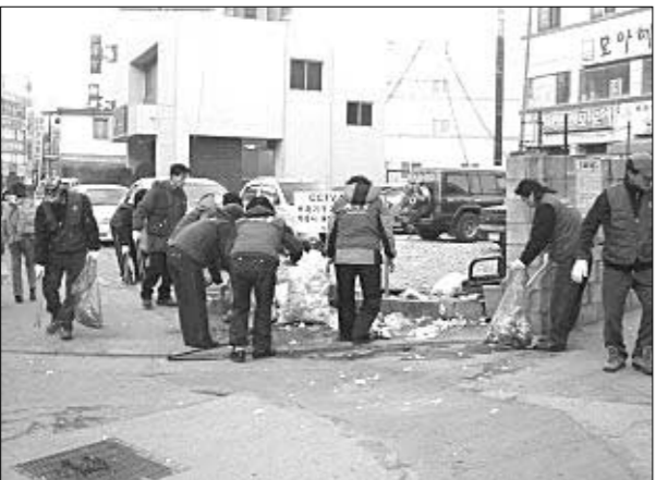
포천시 소흘읍사무소는 설을 맞이하여 쾌적하고 깨끗한 거리환경을 조성하여 즐거운 명절을 보낼 수 있도록 자체적으로 '설 연휴기간 중 완벽한 청소 및 생활쓰레기 수거대책'을 수립하여 다른 지역의 수범이 되고 있다.

술선 참여했다. 한편, 연휴기간 중(2.6~2.10)의 시가지 청소대책으로는 날짜(요일)별로 이장협의회(33명)의 협조와 함께 가로환경미화원 및 일시 사역인부를 긴급 배치하여 매일 시내지역을 중심으로 청소를 실시할 계획이며, 쓰레기수거대행업체인 태성크린(대표 김성태)과 협의하여 6일과 9일 2일간에 걸쳐 시내지역과 국도변을 중심으로 생활쓰레기를 수거했다. 또한 연휴기간중 청소 및 생활쓰레기 수거와 관련하여 주민들의 생활불편을 해결하고자 상환근무자를 편성하여 근무해 하는 등 '감동 주는 열린 행정' 추진을 위해서 철저히 대책을 수립하여 추진해 나갈 방침이다. 하승완 기자 forme65@paran.com