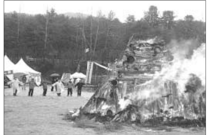
포천시 소흘읍사무소와 노고산성정월대보름축제추진위원회는 금년도에 개최하는 제7회 노고산성 정월대보름 축제'를 오는 2월 20일부터 21일까지 2일간 고모저수지 일원에서 개최하기로 확정하고, 본격적인 축제준비에 들어갔다.

는 우리 고유의 민속명절인 정월대보름을 맞이하여 우리의 전통놀이와 문화예술을 계승·발전시켜 나가는 토대가 될 것"이라며 "창의적인 축제기획과 연출을 통해 누구나 참여하고 체험할 수 있는 문화축제로 발전시켜 포천시는 물론 경기북부, 수도권지역의 대표적인 민속문화 예술축제로 발돋움 할 것"이라고 밝혔다. 하승완 기자 forme65@paran.com