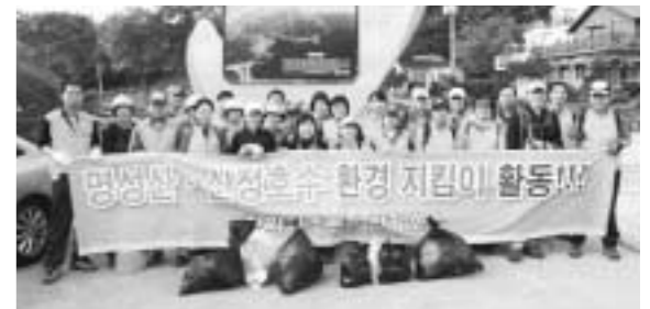
명성산&산정호수 환경 지킴이 한화리조트/산정호수는 창립55주년 기념 및 사회봉사단 설립을 맞이해 10월8일 직원 35명이 명성산&산정호수 환경 지킴이 봉사활동을 실시했다.