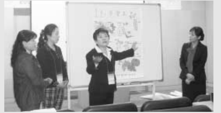
포천시는 10월16일 오전10시부터 오후6시까지 산정호수 한화콘도에서 관내 여성단체 및 주민자치 위원 등 여성지도자 70여명을 대상으로 워크숍을 실시했다.