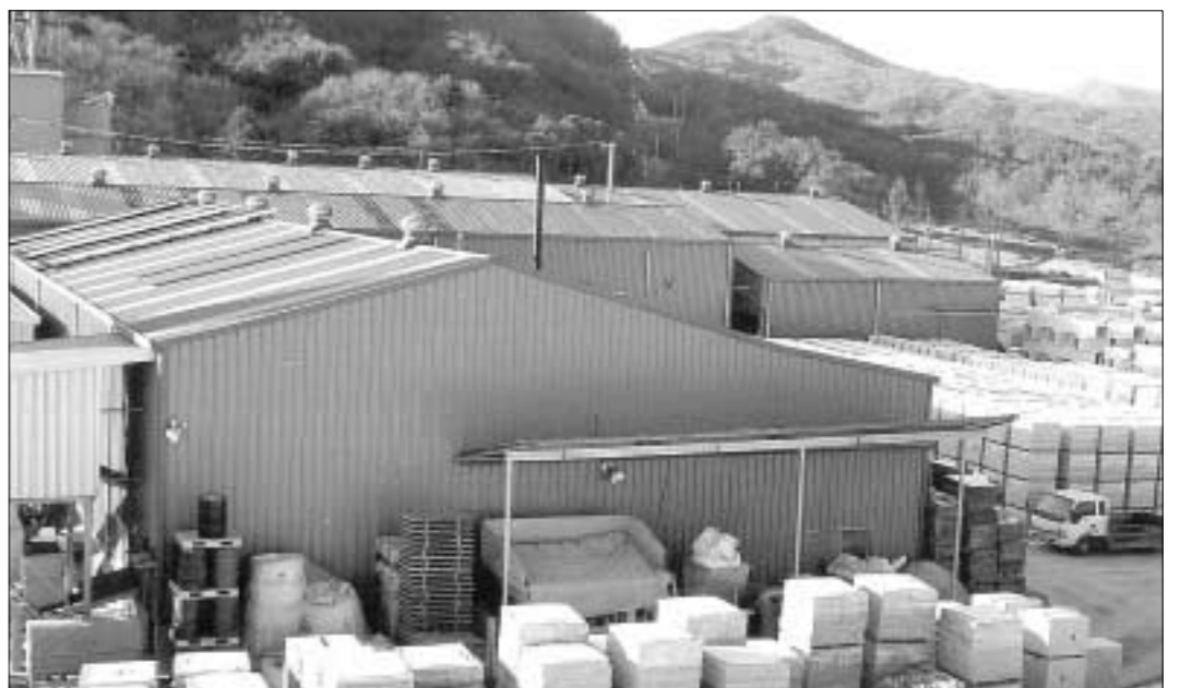
코단콘크리트(주)는 석가공 폐기물과 산업폐기물을 이용하여 습·건식 축대 옹벽 블록을 생산하는 특허 제0552342를 이용하여 축대 블록을 생산하면서 원자재인 산업 폐기물 입고 시 수입이 발생하고, 그것을 원자재로 사용하여 제품을 만들어 공급하고 있다.