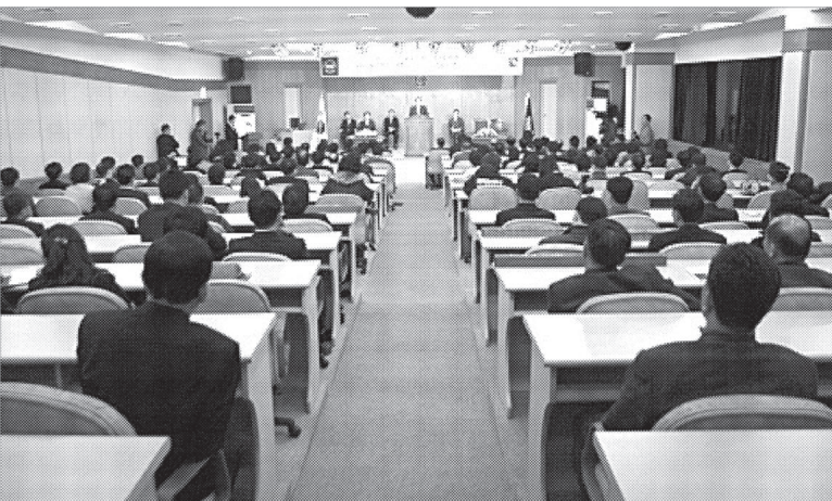
김문수 경기도지사는 12월3일 오후 6시30분 대진대학교 중앙도서관 6층 국제회의장에서 개최된 법무행정대학원 최고경영자과정 제1회 홈 커밍데이에 초청돼 '대한민국의 미래는 경기도가 엽니다'라는 주제로 특강을 실시했다.