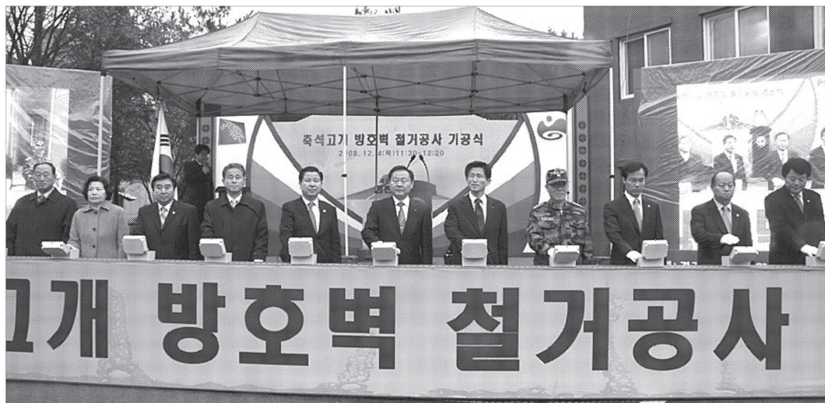
포천시 소흘읍 축석령 대전차 방호벽 철거 기공식이 12월4일 오전 11시30분에 김문수 경기도지사와 김영우 국회의원, 서장원 포천시 시장, 이종호 포천시의회 의장, 이주석, 이우형 경기도의원과 시민 등 300여명이 참석한 가운데 개최됐다.

김영우 국회의원은 "방호벽은 그동안 포천시가 통일시대의 중심도시로 발전하는데 걸림돌이 되어왔다"며 "축석~소흘읍까지 6차선 확장공사 실시계획을 이번